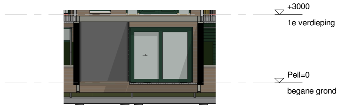
Achtergevel Schuifpui schaal 1:100