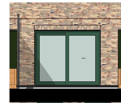
Achtergevel Schuifpui schaal 1:100